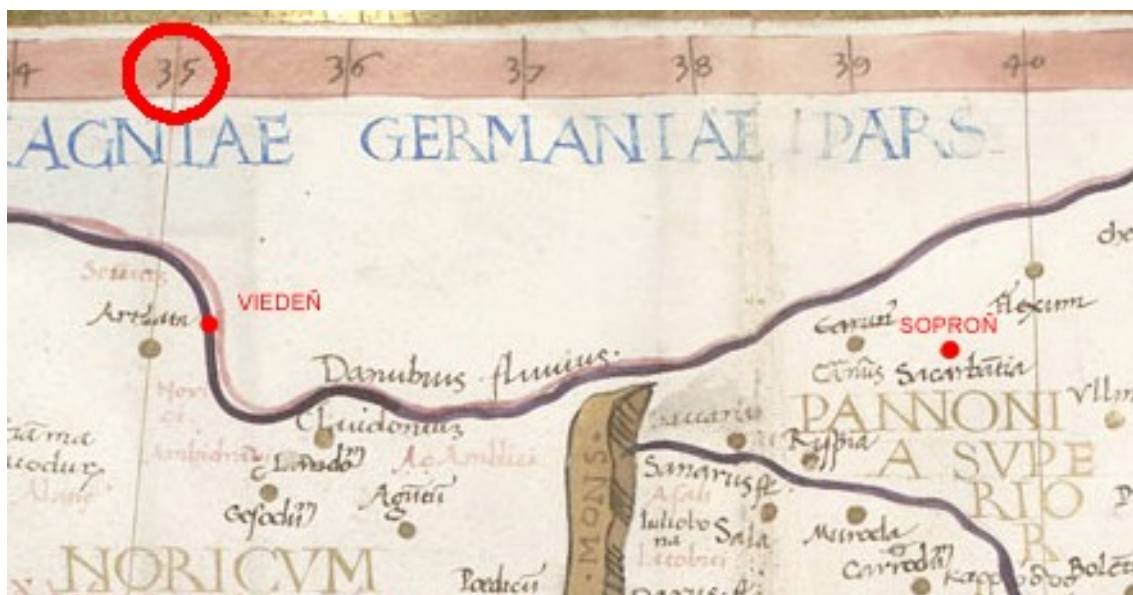
Obr. Detail Ptolemaiovej mapy Panónie

územie Slovenska, použijeme Ptolemaiovu mapu Panónie. Oporný bod pre nás je mesto Šoproň v Maďarsku, ktorého historický názov je Scarbania , u Ptolemaia SACARBATIA. Pri 35. poludníku je zakreslený výrazný ohyb Dunaja totožný s ohybom, kde dnes leží Viedeň. Za týmto poludníkom začína teda na Ptolemaiovej mape MAGNA GERMANIA územie Slovenska a to mestom Bratislava.