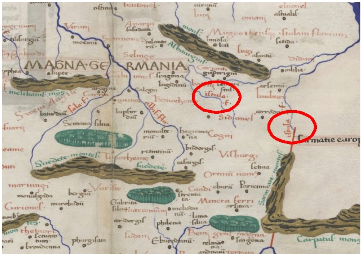
Obr. Poľská rekonštrukcia Ptolemaiovej mapy so zakresnenou Vislou a Dunajcom

Všetci dobre vieme, že pri sútoku dvoch riek preberá výsledný tok pomenovanie vždy po rieke väčšej. Prítok Dunajca je silnejší ako prítok Visly. Ak rieka ďalej tečie pod menom Visla, pomenovanie dostala od rieky Dunajec, ktorý sa v minulosti volal ISTULA.