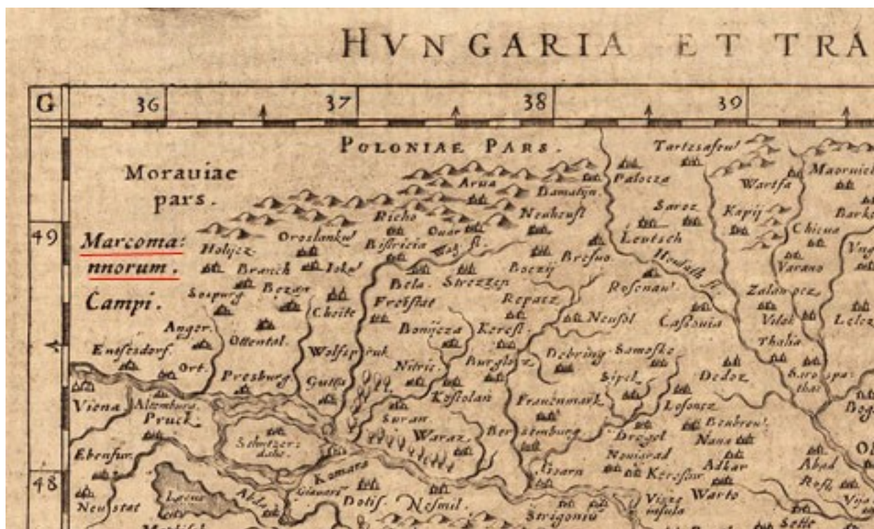
Obr. Marcomannorum Campi pre označenie územia Moravy

Galighaniho stredoveký knižný popis Uhorska z roku 1621 naznačuje, že ešte v 17. storočí sa používal termín Marcomani pre označenie Moravanov a Moravy.