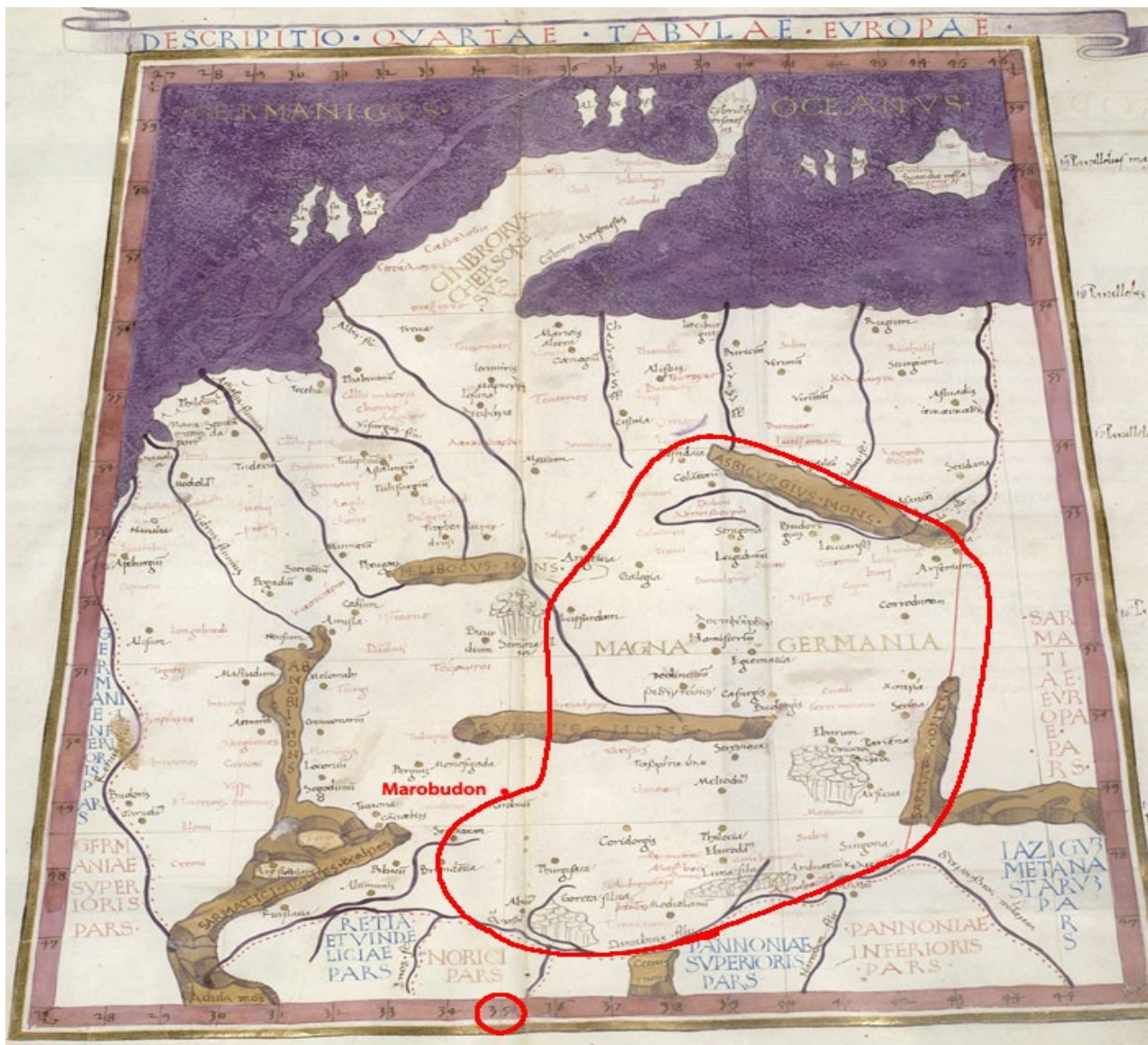
Obr. Vyznačené územie Slovenska na mape MAGNA GERMANIA