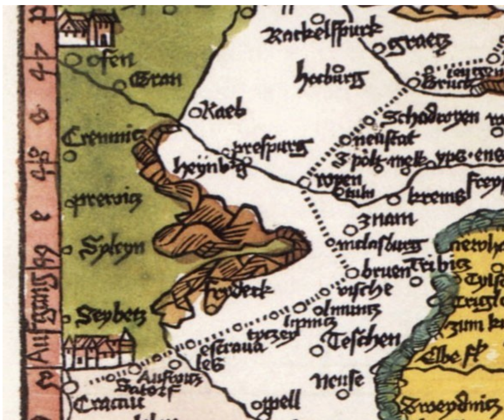
Obr. Mesto SEYBETZ ako súčasť Slovenska - Uhorska